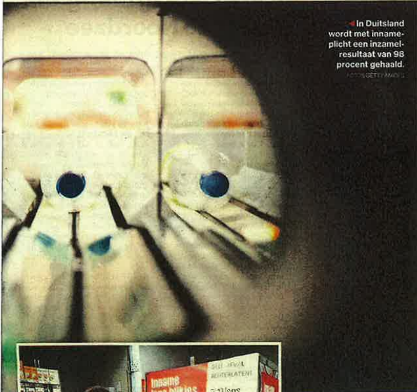
◀ In Duitsland wordt met innameplicht een inzamelresultaat van 98 procent gehaald.