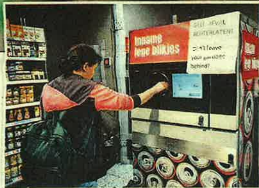
▲ Sinds 1 april is er ook statiegeld op blikjes.

Daarnaast kwamen er speciale inzamelbakken bij bijvoorbeeld sportclubs en bioscopen. Het statiegeld daarvan gaat naar het goede doel. Dat klinkt sympathiek, zegt Rob Buurman, directeur van RNB. „Maar er zijn amper extra punten gekomen waar je ook echt geld terugkrijgt. Uiteindelijk ondermijnt dat de werking van het systeem. De prikkel om in te leveren ontbreekt op veel plekken.” De cijfers geven hem gelijk. Een inzamelcijfer van slechts 58 procent kleine flesjes laat zien dat het systeem nu niet goed werkt. Of de resultaten bij de blikjes beter zijn, is onbekend: de eerste officiële cijfers komen pas over een jaar.